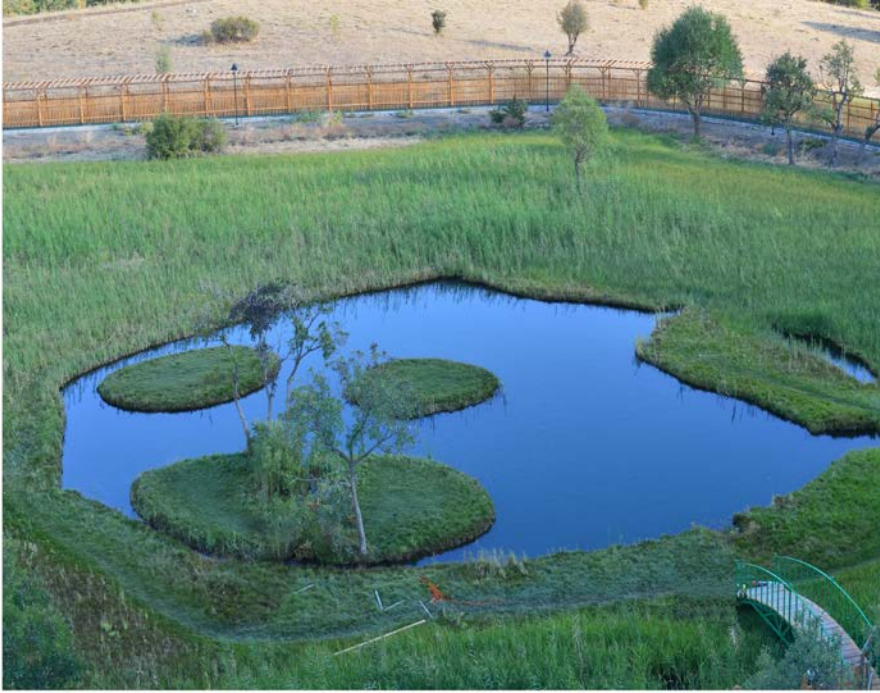
Şekil 1. Bingöl Yüzen Adalar'ın fotoğrafı