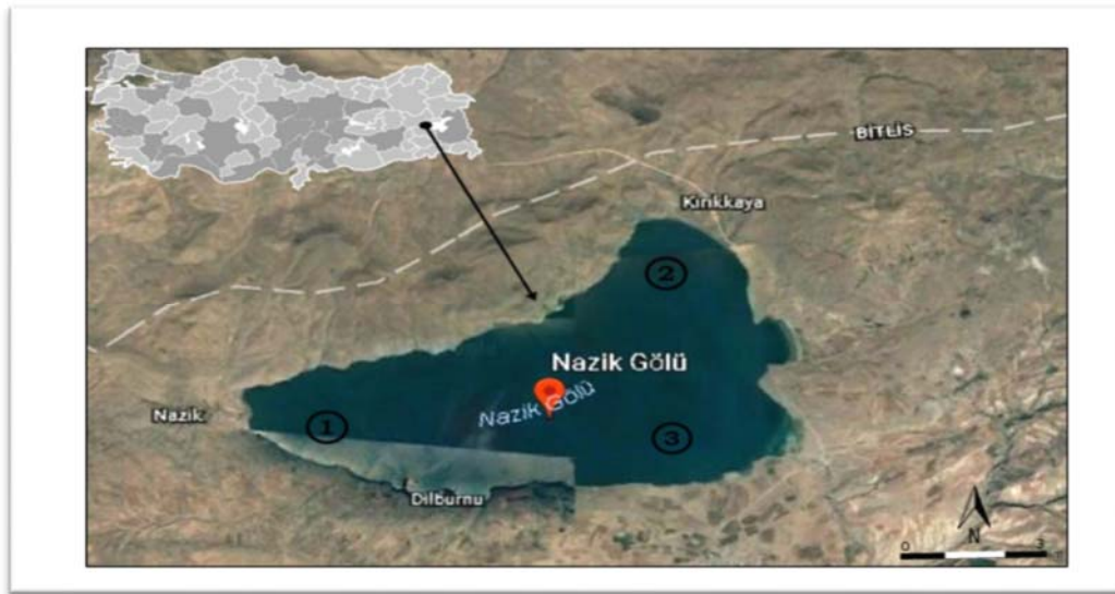
Şekil 1. Nazik Gölü ve örnekleme istasyonları (URL-1, 2017)

Ocak 2014-Şubat 2015 tarihleri arasında belirlenen üç istasyondan (I. istasyon 42 13 43.87 D, 38 51 20.84 K; II. istasyon 42 18 33.94 D, 38 53 25.27 K; III. istasyon 42 18 50.58 D, 38 50 55.49 K) mevsimsel olarak alınan su ve plankton numuneleri incelenmek üzere Elazığ Su Ürünleri Araştırma Enstitüsü Müdürlüğü Laboratuvarlarına getirilmiştir (Şekil 1) (URL-1, 2017).